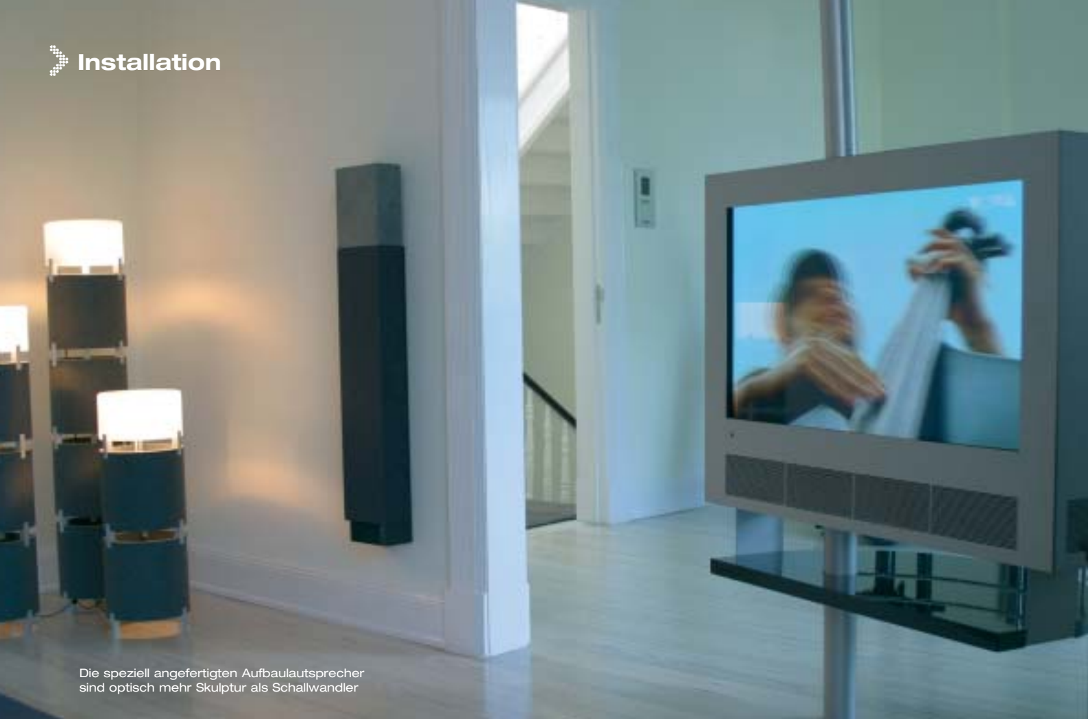
Die speziell angefertigten Aufbau Lautsprecher sind optisch mehr Skulptur als Schallwandler