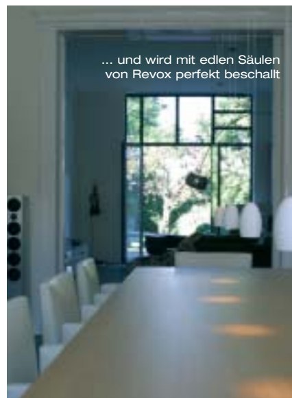
... und wird mit edlen Säulen von Revox perfekt beschallt