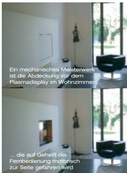
Ein mechanisches Meisterwerk ist die Abdeckung vor dem Plasmadisplay im Wohnzimmer...

Den Wohnraum, das Zentrum des Hauses, dominiert die mehr als mannshohe Natursteinwand, die – mit viel Liebe zum Detail – auf der Terrasse fortgeführt wird. Die integrierte Nische mit Beleuchtung akzentuiert das schwere Material, so dass es leicht und spielerisch wirkt. Auf der gegenüberliegenden Seite findet sich ein Stück mechanischer Feinarbeit. Ein gut drei Meter breites, mit Stoff bezogenes Panel verbirgt den 42 Zoll großen Plasmafernseher. Auf Geheiß der Fernbedienung fährt die maßgenau eingepasste Abdeckung einen guten Zentimeter nach hinten und verschwindet lautlos zur Seite. Beim Ausschalten kehrt sich das Schauspiel selbstverständlich um.