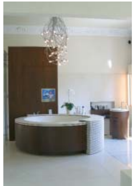
Das Bad dominiert die zentrale Whirlwanne mit ihrer markanten Umrandung