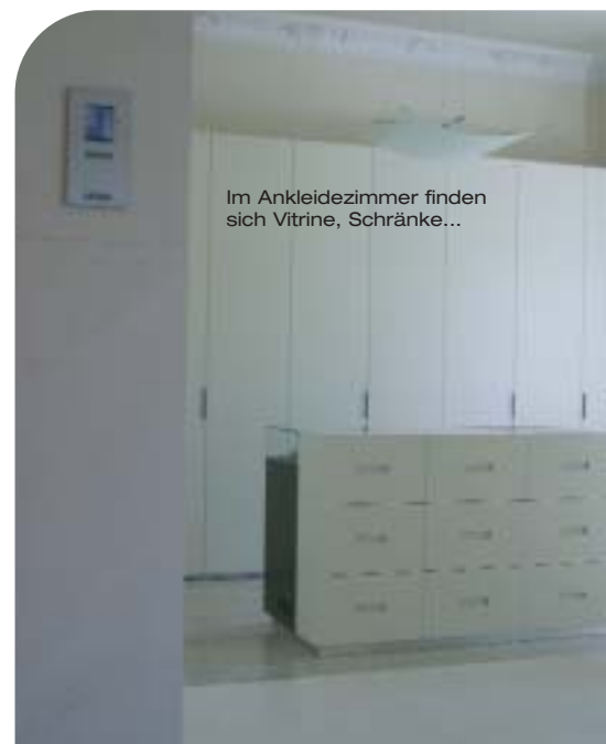
Im Ankleidezimmer finden sich Vitrine, Schränke...