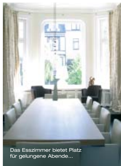
Das Esszimmer bietet Platz für gelungene Abende...

Im angrenzenden Speisezimmer darf natürlich die akustische Untermauerung zu den kulinarischen Genüssen nicht zu kurz kommen, auch hier sind zwei Revox-Töner aufgestellt, die dank ihrer Aluminiumoberfläche perfekt mit dem Innenraum harmonieren. Vom Durchgang zum Wohnzimmer aus tönen sie zur Gebäudefront, so dass man selbst in der liebevoll arrangierten Sitzecke auf der Empore noch feinsten Sound genießen kann. ▶