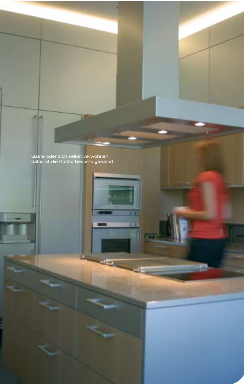
Gäste oder sich selbst verwöhnen, dafür ist die Küche bestens gerüstet