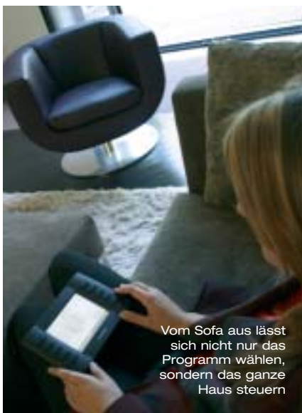
Vom Sofa aus lässt sich nicht nur das Programm wählen, sondern das ganze Haus steuern

Der Zugang zum Haus erfolgt selbstverständlich schlüssellos, kleine Sender verraten die Annäherung der Besitzer und erlauben das Öffnen der Eingangstür. Im Entree erwartet ein großformatiges Display die Bewohner und harret ihrer Befehle. Es fällt schwer, sich zwischen dem laufenden Fernsehbild und dem daneben befindlichen Vivarium mit den südamerikanischen Pfeilgiftfröschen zu entscheiden. Von hier kann zentral alles geschaltet werden, von individuellem Sound in den einzelnen Räumen bis hin zur Abfrage, ob irgendwo noch Fenster oder Türen geöffnet oder gekippt sind. Das System weiß sehr wohl zwischen diesen Zuständen zu unterscheiden, um den Bewohnern unnötige Wege durch die drei Etagen zu ersparen.