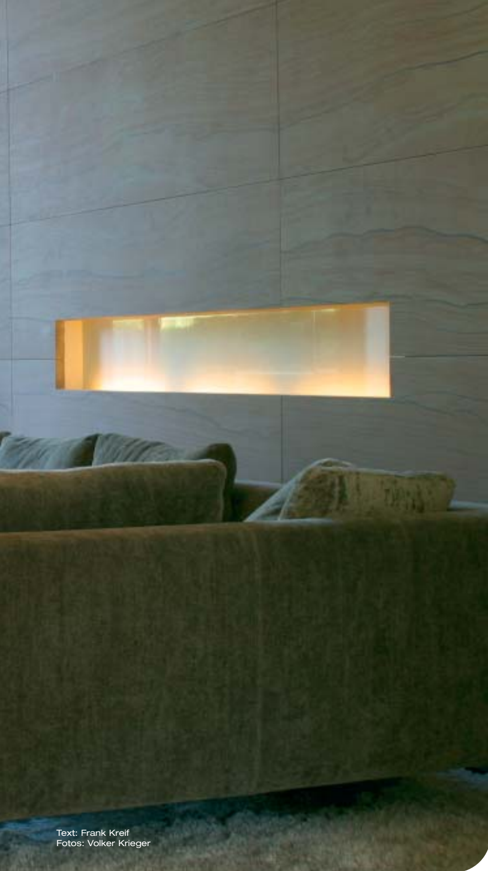
Text: Frank Kreif