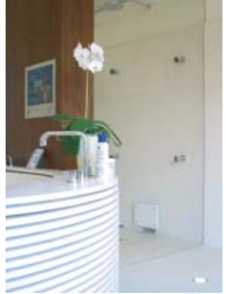
Hinter Glas: Der Duschtempel mit üppig dimensionierter Sitzgelegenheit