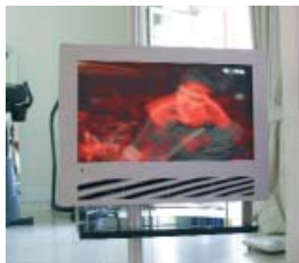
Der drehbar gelagerte Plasmabildschirm ist sowohl vom Schlafzimmer aus, als auch aus dem Fitnessbereich nutzbar