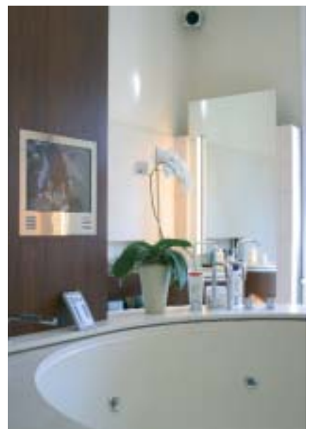
Aromatherapie und atemberaubender Thriller: Hier kein Problem