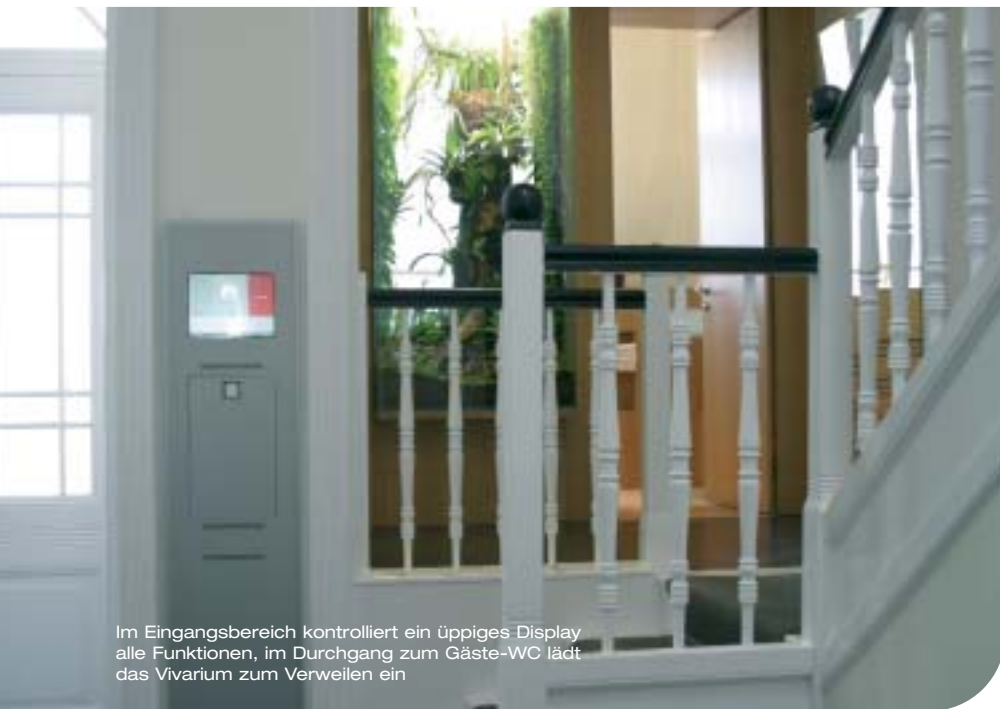
Im Eingangsbereich kontrolliert ein üppiges Display alle Funktionen, im Durchgang zum Gäste-WC lädt das Vivarium zum Verweilen ein