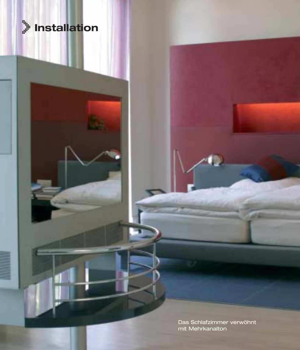
Das Schlafzimmer verwöhnt mit Mehrkanalton