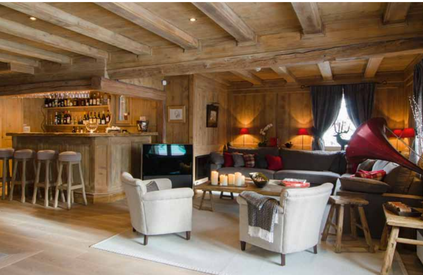
Der großzügige Living-Bereich bietet jede Menge kuschelige Ecken. Beliebter Treff: die stimmungsvolle Bar im Salon.